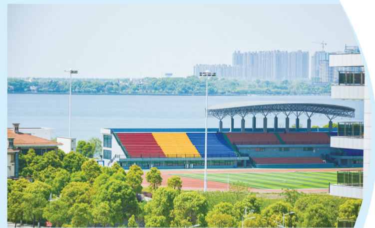
▲田径场一隅