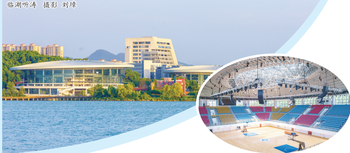
临湖听涛