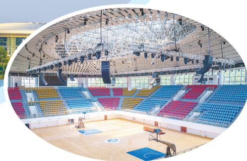
于无声处