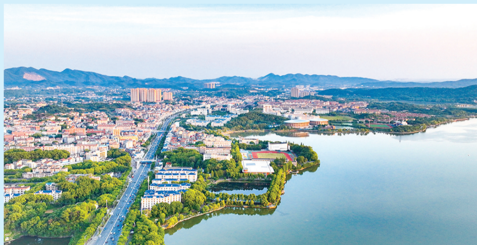
▲校园鸟瞰