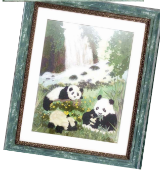
湖南省花博会平面押花特等奖作品