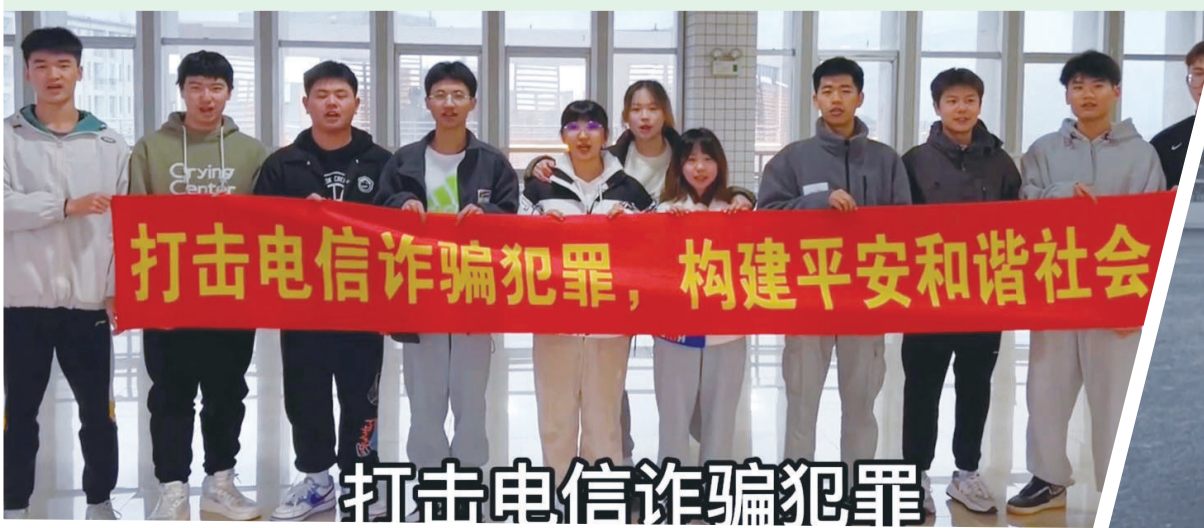
打击电信诈骗犯罪，构建平安和谐社会