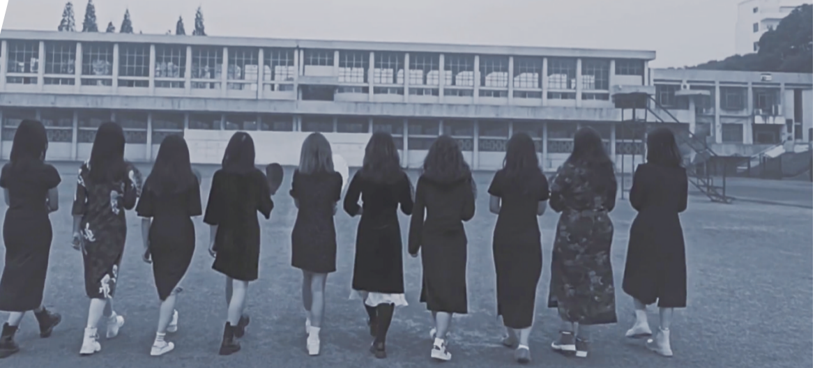
湖鲤映画——《金陵十三钗》剧组剧照