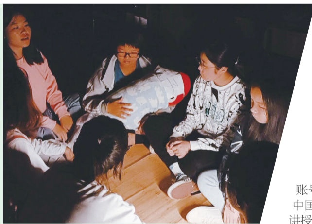
湖鲤映画——《滇缅公路》剧组剧照。