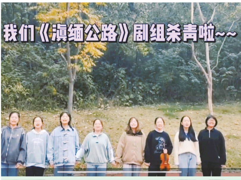
我们《滇缅公路》剧组杀青啦~~