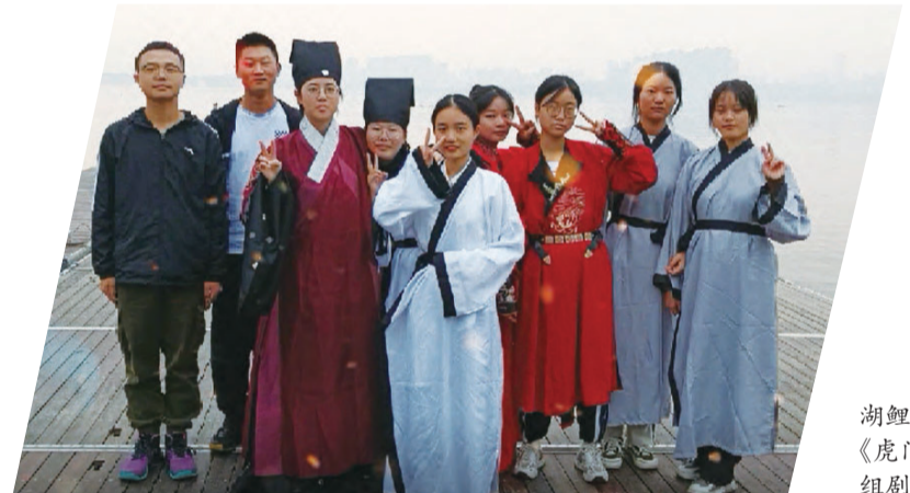
湖鲤映画——《虎门销烟》剧组剧照。