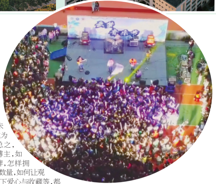
抖音校园博主“单子[飞机相机]”围绕湖理进行的拍摄。

也许在成为更高人气博主道路上，校园博主们还有很长的路需要走，但他们的热爱与坚持，如针如线，正编织着属于自己最独一无二的彩色青春！